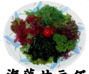
海藻サラダ とってもヘルシー