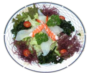
かなやサラダ 自家製ドレッシング